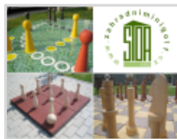
STOA - Zahradní a venkovní hry