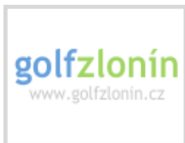
Golf Club Zlonín